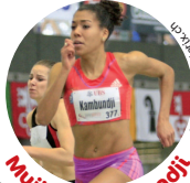
Mujinga Kambundji Schweizer Juniorinnen-Rekord 100m und 200m