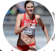
Lea Sprunger Participante Jeux olympiques 2012 200m et 4x100m, Suisse