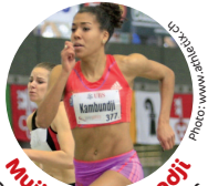
Mujinga Kambundji Record suisse junior femmes 100m et 200m