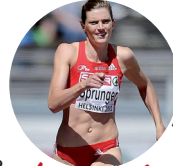
Lea Sprunger Teilnehmerin Olympische Spiele 2012 200m und 4x100m, Schweiz