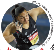
Valerie Adams Championne olympique 2008 et 2012 Lancer du poids, Nouvelle-Zélande

Compétition trinationale d'athlétisme pour les enfants de moins de 14 ans A partir de 13:00 échauffement avec les athlètes de haut niveau suivants