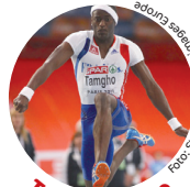
Teddy Tamgho Weltmeister 2013 Dreisprung, Frankreich