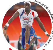
Teddy Tamgho Champion du monde Triple saut, France