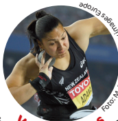
Valerie Adams Olympiasiegerin 2008 und 2012 Kugelstossen, Neuseeland

Trinationaler Leichtathletik-Wettkampf für alle Kinder bis 14 Jahre Ab 13:00 gemeinsames Aufwärmen mit den internationalen Spitzensportlern