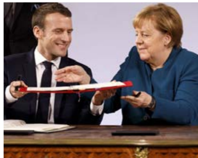
Unterzeichnung Aachener Vertrages

In Folge dessen wurde der TEB-Präsident zur Unterzeichnungszeremonie des Aachener Vertrages am 22. Januar 2019 in Anwesenheit der deutschen Bundeskanzlerin Angela Merkel und des französischen Präsidenten Emmanuel Macron eingeladen.