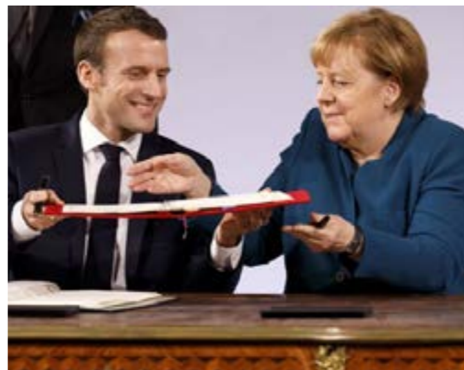
Signature du traité d'Aix-la-Chapelle

Enfin, le président de l'ETB a été invité à la cérémonie de signature du Traité d'Aix-la-Chapelle le 22 janvier 2019 en présence de la chancelière allemande Angela Merkel et du président français Emmanuel Macron.