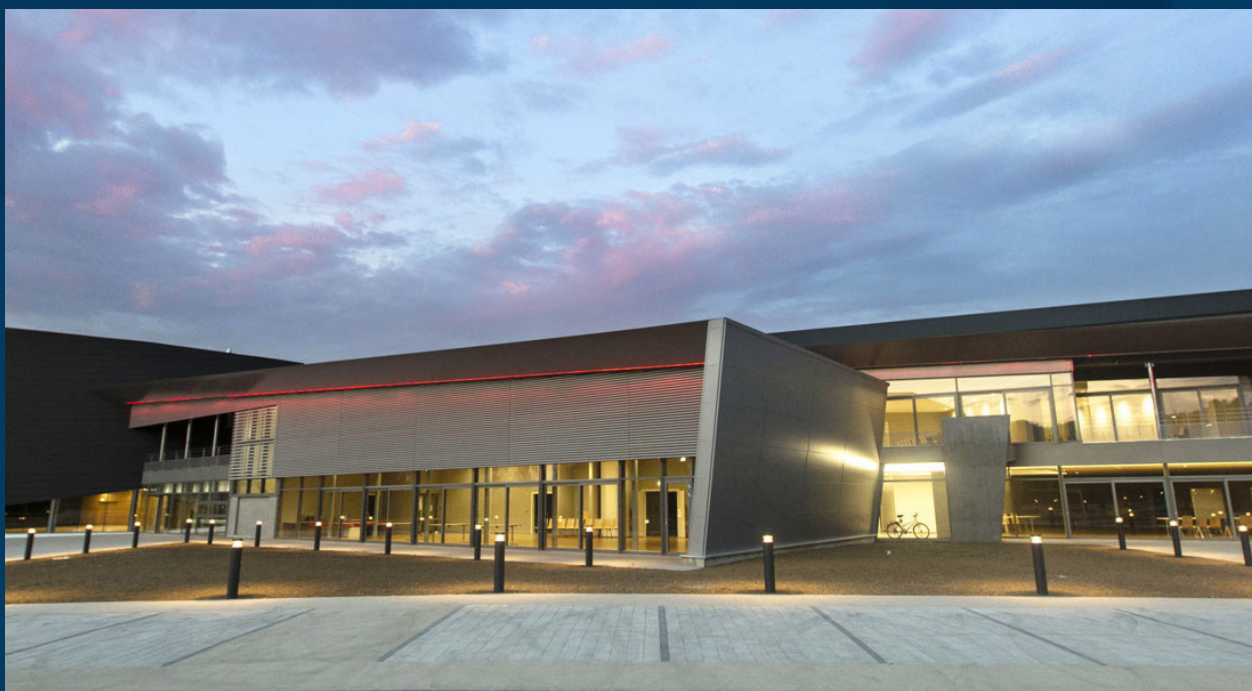
La Comète - Héisingue

Vom Bahnhof Basel SBB: Tram 6 - Haltestelle Gartenstrasse, dann Bus 608 - Haltestelle Héisingue Eglise