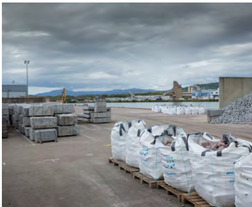
Projet Vis-à-Vis / Projekte Vis-à-vis

Le projet Vis-à-Vis peut être considéré comme le premier projet de réalisation du projet 3Land.