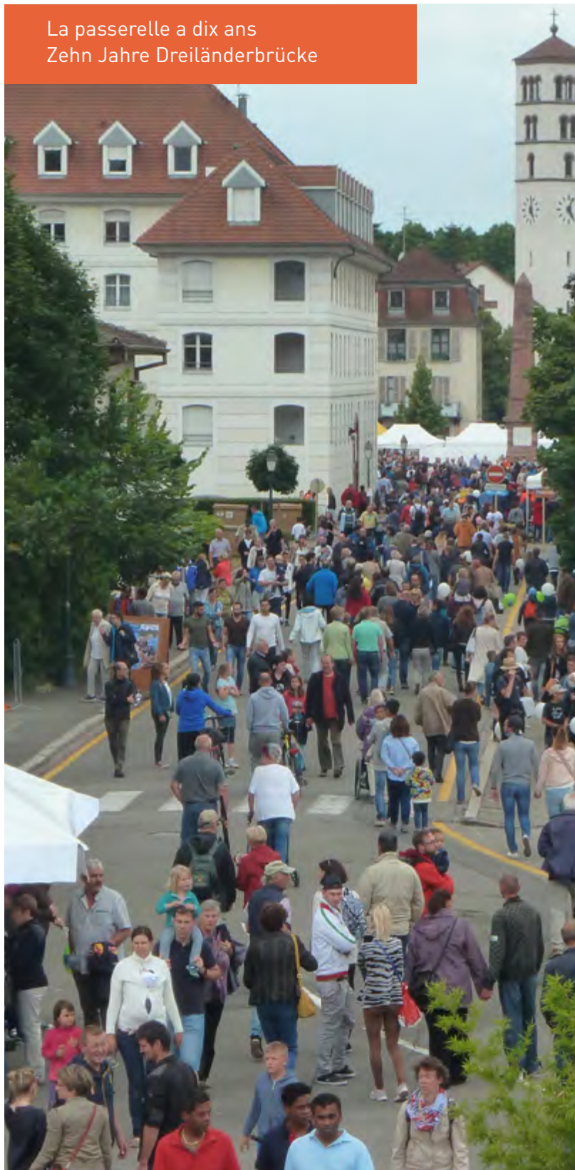
La passerelle a dix ans Zehn Jahre Dreiländerbrücke

Après avoir piloté la remise en forme du site internet de l'ETB et la création d'une newsletter, le groupe communication s'est peu réuni en 2015 et 2016. Ce groupe de projet ne s'est pas réuni en 2017. L'amélioration et l'actualisation du site Internet de l'ETB s'est fait directement par le directeur avec le soutien de son équipe et d'un prestataire extérieur.