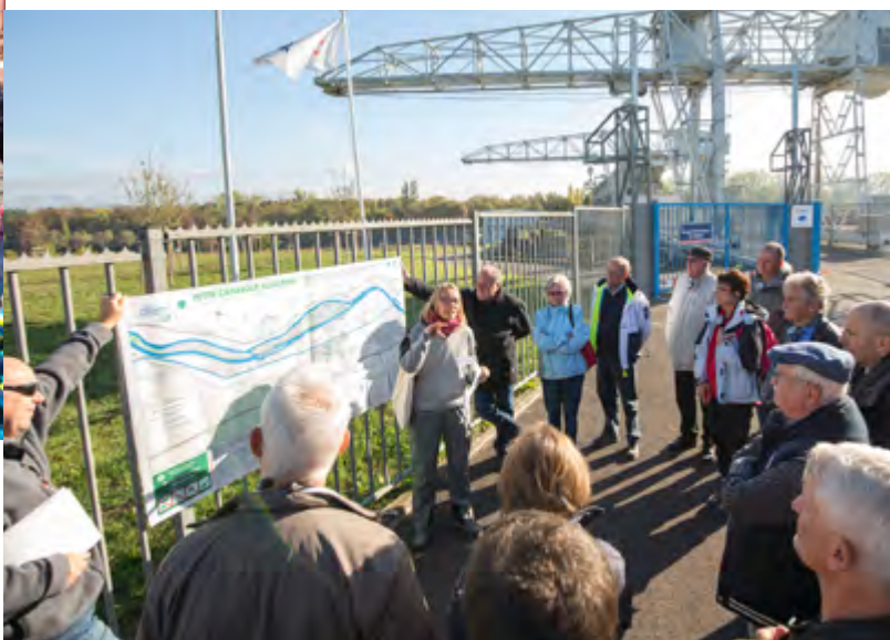
Petite Camargue Alsacienne