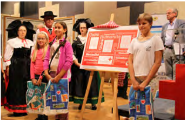
Première exposition Philatélique internationale Croix Rouge