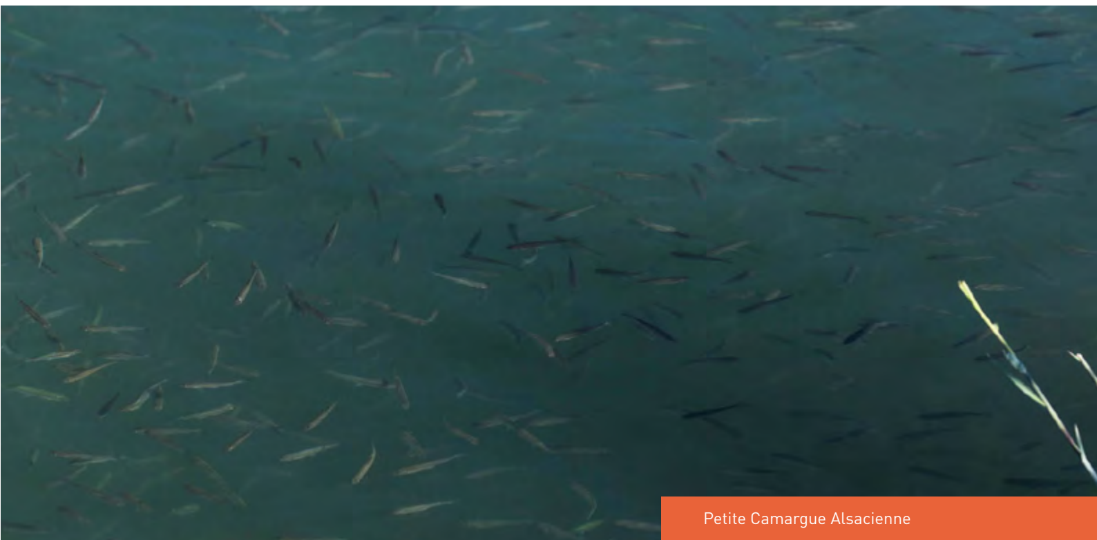
Petite Camargue Alsacienne