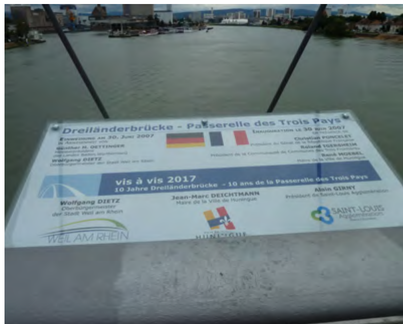
Passerelle des Trois Pays / Dreiländerbrücke

Das Projekt Vis-à-vis kann als einer der ersten Realisierungen des Projekts 3Land gesehen werden.